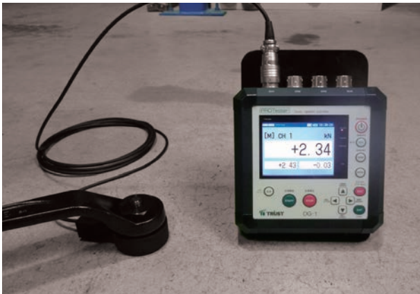
◎レンチ式試験装置との組合せ