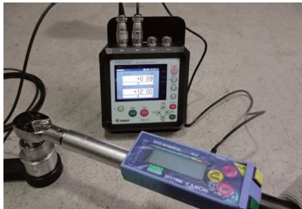
◎レンチ式試験装置+トルクレンチとの組合せ