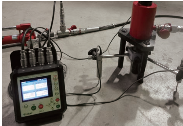
◎油圧式試験装置+変位変換器との組合せ