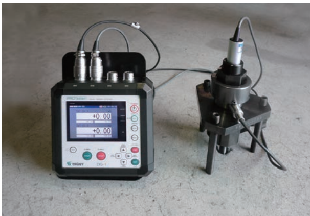
◎レンチ式試験装置+変位変換器との組合せ